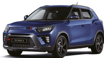
Metalická barva DANDY modrá (BAS)