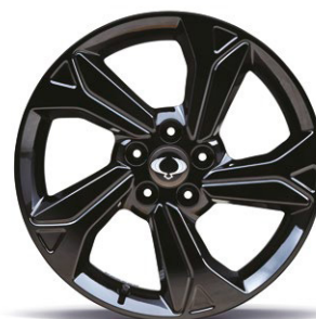
18" černá ALU kola "Diamond Cutting", pneumatiky 215/50 R18