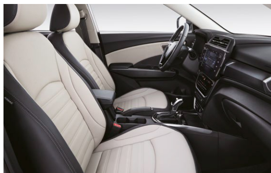
Světle šedý dvoutónový interiér (EBG)*

*Foto je pouze ilustrativní, na českém trhu je v nabídce pouze textilní potah sedadel.