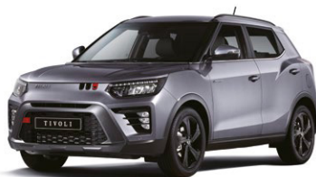
Metalická barva IRON kovová (ADE)