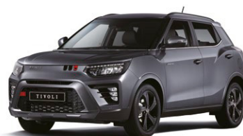
Metalická barva PLATINUM šedá (ADA)