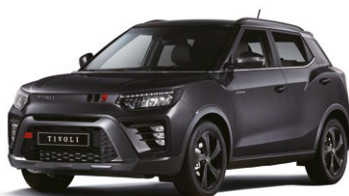
Metalická barva SPACE černá (LAK)