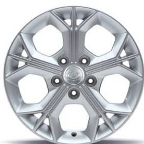
16" ALU kola, pneumatiky 205/65 R16