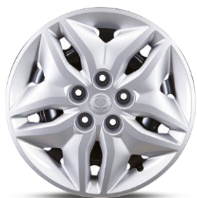
16" ocelová kola, pneumatiky 205/65 R16