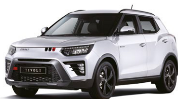
Základní barva GRAND bílá (WAA)