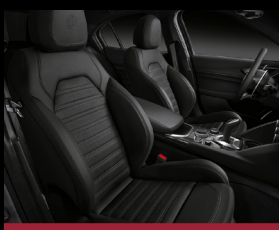
Sportovní kožená sedadla (788) – standard