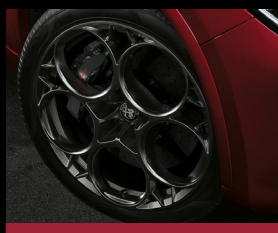
21" kola z lehkých slitin QV Prototipo (3EQ)