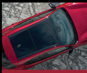
Elektricky ovládané panoramatické střešní okno (400)