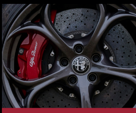
Karbon-keramické brzdy (BRM) *červené lakované třmeny lze objednat i na standardní brzdový systém