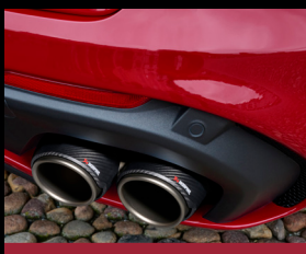
Titanový výfukový systém Akrapovič (NEC)