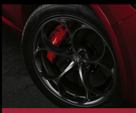
20" kola z lehkých slitin QV Classico (3EN) – standard